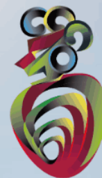
Distintivo de Integridad Empresarial